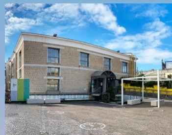
URicTer - Caserta