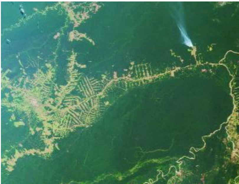
Amazzonia, Brasile.

La diversità di specie (o ricchezza di specie) è una misura fondamentale per valutare la biodiversità di un luogo: più specie ci sono e più è elevata la sua biodiversità. Si misura solitamente sul campo raccogliendo i campioni nel loro habitat. La diversità di ecosistemi è una misura dei vari tipi di ambienti e delle comunità viventi presenti in una data zona. E' abbastanza difficile da determinare perché i confini tra un ecosistema e l'altro sono spesso poco definiti. Per studiarla, si utilizzano sia rilevamenti sul campo sia strumenti appositi come cartine topografiche o rilevamenti satellitari. La diversità funzionale deriva invece dalle relazioni che esistono tra un organismo e l'altro e tra gli organismi e il loro ambiente. Viene valutata suddividendo le varie specie in categorie basate sul ruolo degli organismi nella catena alimentare, come per esempio erbivori, parassiti, super-predatori.