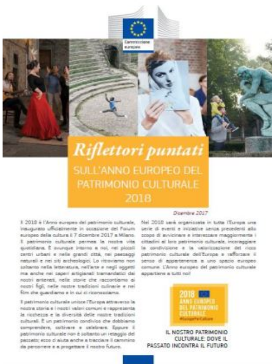
Figura 5. Brochure della Commissione Europea dicembre 2017 "Riflettori puntati sull'Anno Europeo del Patrimonio Culturale 2018"