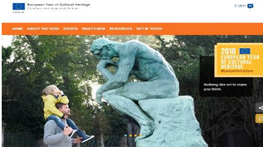
Figura 1. Homepage del sito web ufficiale europeo "2018 European Year of Cultural Heritage"

Data la costante attenzione e sensibilità da parte dell'Unione Europea nei confronti della Cultura, è stato designato il 2018 "Anno Europeo del Patrimonio Culturale" 3 che sarà dedicato alla promozione della diversità culturale, del dialogo interculturale e della coesione sociale. L'impegno si rivolge ad evidenziare il contributo economico dei beni culturali per i settori culturali e creativi e a sottolineare il ruolo del patrimonio culturale nelle relazioni esterne dell'Ue.