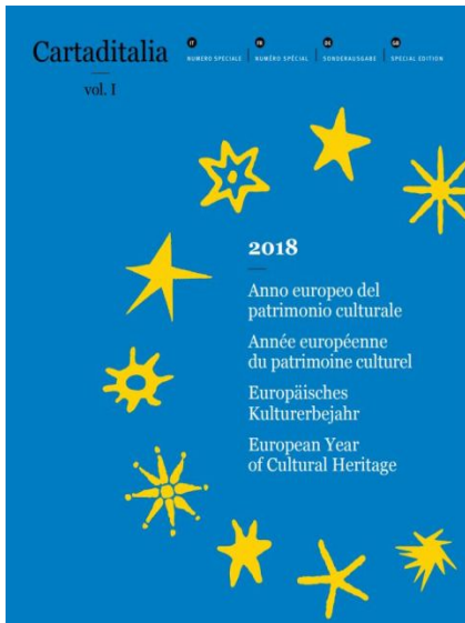
Figura 4. Frontespizio della rivista "Cartaditalia" Vol. 1/2017, numero speciale dedicato al 2018 Anno Europeo del Patrimonio Culturale