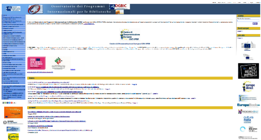
Figura 3. Homepage del sito web OPIB - Osservatorio dei Programmi Internazionali per le Biblioteche

Al momento, nella Sezione Speciale di Documentazione "2018 Anno Europeo del Patrimonio Culturale" si segnalano anche alcune specifiche pubblicazioni dell'Unione Europea: